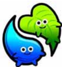
水の妖精:きらら 緑の妖精:はっぴー

1月1日の岡崎市と額田町の合併に伴い、額田町視聴覚ライブラリーは岡崎市視聴覚ライブラリーに一本化されます。したがって、額田町視聴覚ライブラリーの資産については、岡崎市視聴覚ライブラリーで運用されるようになります。(一部機器については、額田中学校で管理をします。)